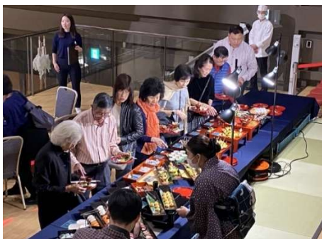
シンガポールツアーの様子