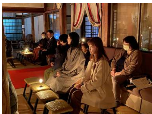
和ろうそく瞑想体験(山の寺院群)