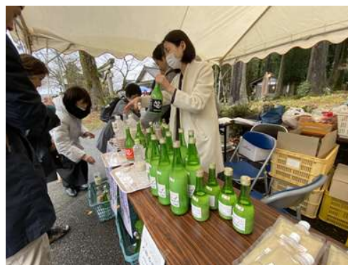
どぶろくの飲み比べ(どぶろく祭り)