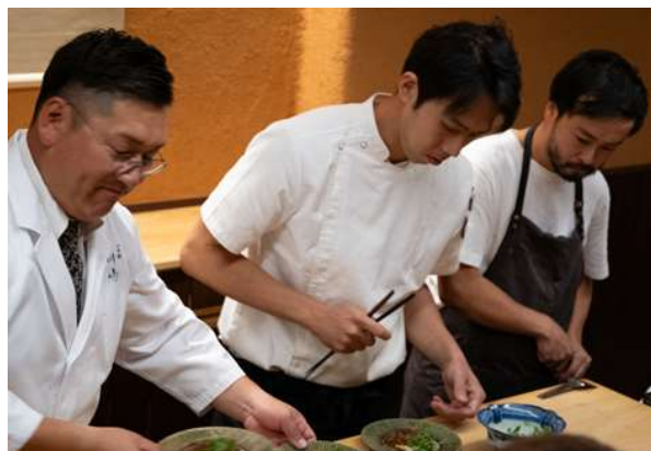
七尾の名店の料理人3名が織りなす特別ディナー