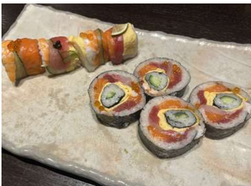
「でか山」をモチーフとした手綱寿司