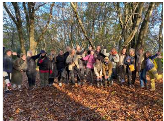
石動山トレッキング