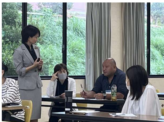
おもてなし研修の様子