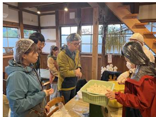
モニターツアーの様子