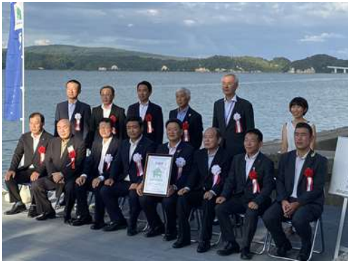
みなとオアシス登録記念セレモニー(登録証交付式)