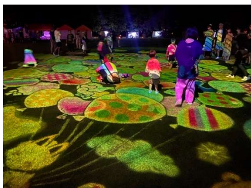
光の切り絵(緑地帯)