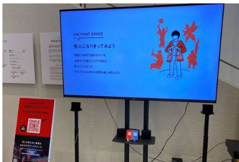
音声ガイド紹介モニター設置

音声ガイドが、簡単な語源と分かりやすい表現を用いているかなどのネイティブチェックを実施し、音声ガイドの改良を実施。