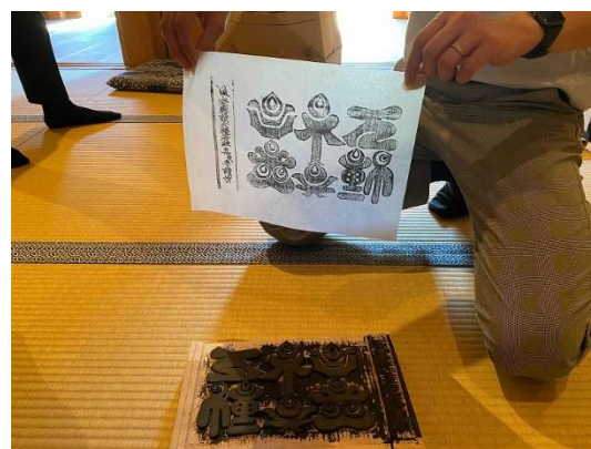
護符づくりクラフト体験開発