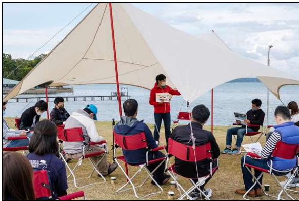
和倉温泉キャンピング・オフィス事業