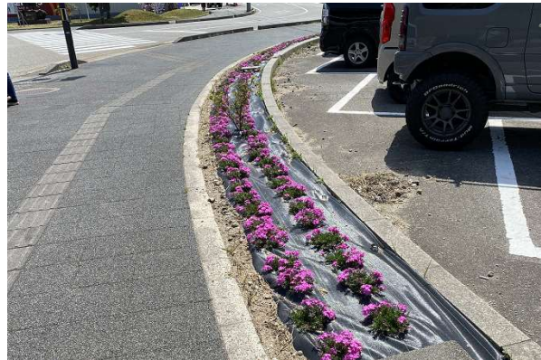
芝桜植樹(小丸山公園下観光専用駐車場)