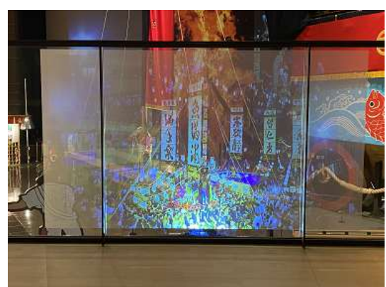
2階休憩ゾーンでのお祭りシアター投影