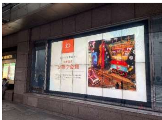
香林坊大和正面ウィンドウ