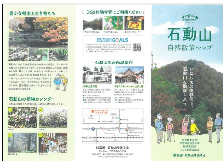
石動山 自然散策マップ