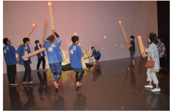
「手松明」づくり体験教室の様子

音声ガイドが、簡単な語源と分かりやすい表現を用いているかなどのネイティブチェックを実施し、音声ガイドの改良を実施。