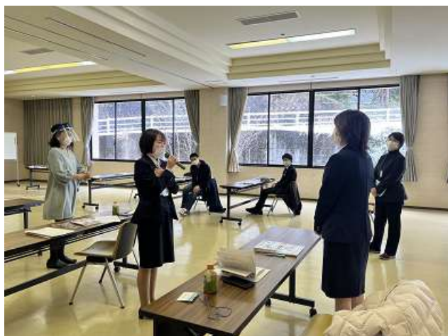
初級クラスの様子