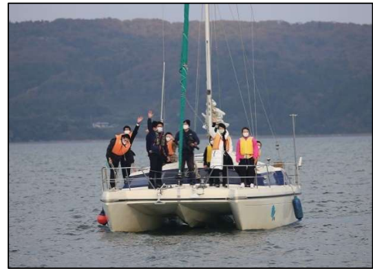
WAKURA大人のヨットセーリング事業