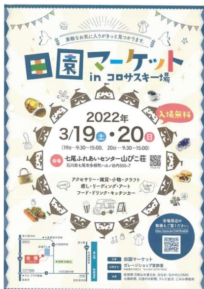
田園マーケットチラシ

事業内容：(1) 石動山夏の縁〔石動山御開山 泰澄大師が舞ったと伝授される演舞〕 (2) 石動山秋のつどい〔白山修験者と歩くいするぎ祈りウォーク〕 (3) 石動山観光PR動画製作〔石動山 森と水の物語～すべては一滴の水～〕 (4) SDGs ツーリズム用ツール〔自然散策マップ、バードコール(鳥笛)〕 (5) 田園マーケット in コロサスキー場〔イベント誘致〕