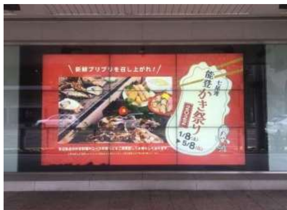
金沢エムザ正面ウィンドウ