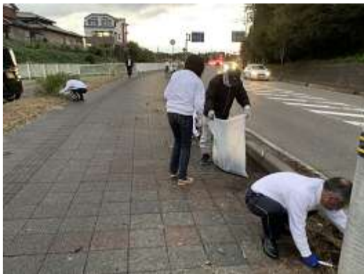
植樹前の除草作業

協力団体: 一本杉通り振興会、のと共栄信用金庫ボランティアーズ、公益社団法人七尾青年会議所、七尾市交流推進課、和倉温泉旅館協同組合