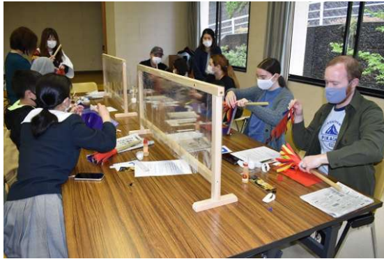
「ざい」づくり体験教室の様子