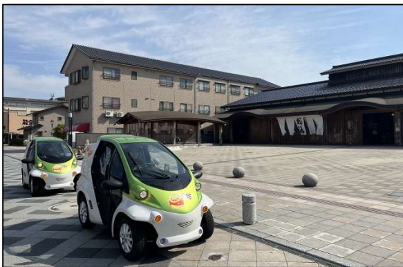
超小型EV（電気自動車）運用実証事業