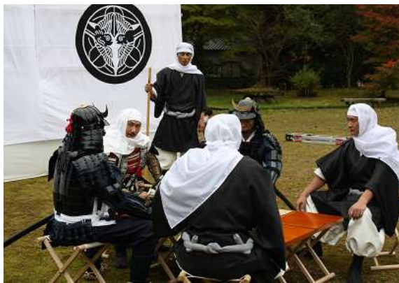
石動山における月見の宴の陣内再現(資料映像制作)

石動山は能登の山岳信仰の霊場であり、石動山秋のつどいのウォーキングにおいて、山伏の行者装束の修験道体験や剣の舞などの資料映像を作成体験プログラムとして、僧兵衣装の着付け体験や護符づくりクラフト体験を開発。