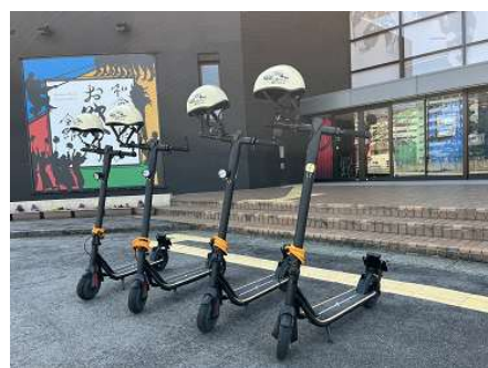
観光コンテンツの磨き上げ(電動キックスケーター)